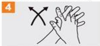
4 Frótese las palmas de las manos entre sí, con los dedos entrelazados;