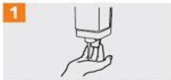
1 Deposite en la palma de la mano una cantidad de jabón suficiente para cubrir todas las superficies de las manos;