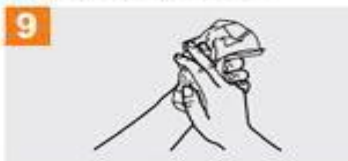
9 Séquese con una toalla desechable;