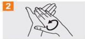
2 Frótese las palmas de las manos entre sí;