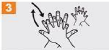
3 Frótese la palma de la mano derecha contra el dorso de la mano izquierda entrelazando los dedos y viceversa;