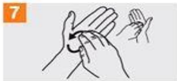
7 Frótese la punta de los dedos de la mano derecha contra la palma de la mano izquierda, haciendo un movimiento de rotación y viceversa;