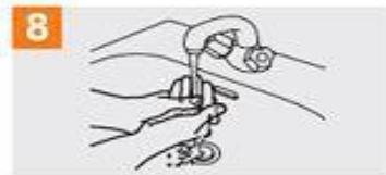
8 Enjuáguese las manos con agua;