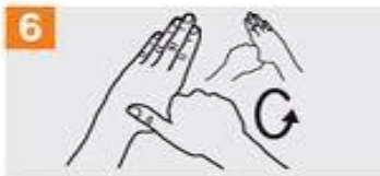
6 Frótese con un movimiento de rotación el pulgar izquierdo, atrapándolo con la palma de la mano derecha y viceversa;