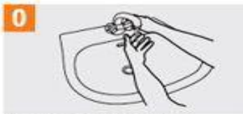
0 Mójese las manos con agua;