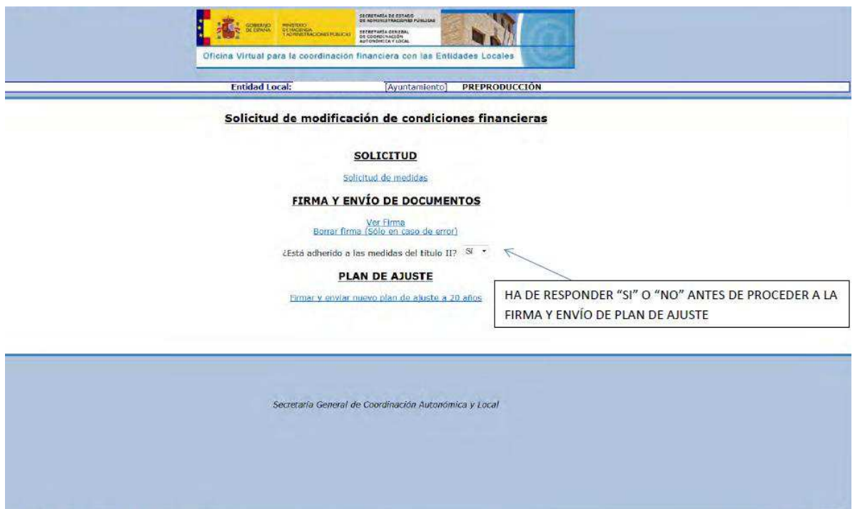
Figura 2.9a - Opción 1

Para continuar con el proceso de entrega deberá enviar y firmar un nuevo plan de ajuste (que sustituirá al plan de ajuste vigente) haciendo clic en el enlace “Firmar y enviar nuevo plan de ajuste a 20 años”. La plantilla de dicho plan se encuentra disponible en la Oficina Virtual (Figura 2.11).