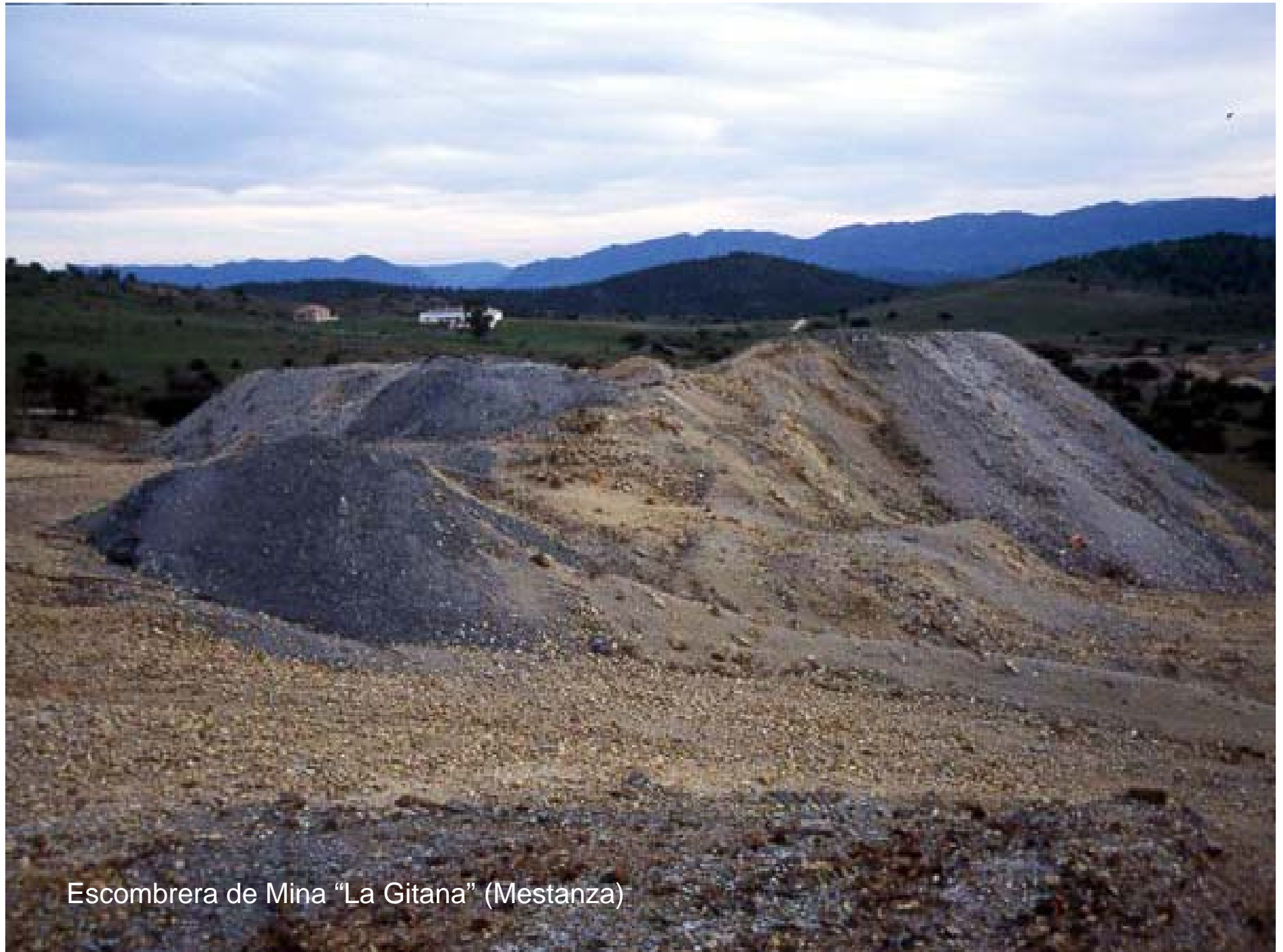
Escombrera de Mina "La Gitana" (Mestanza)