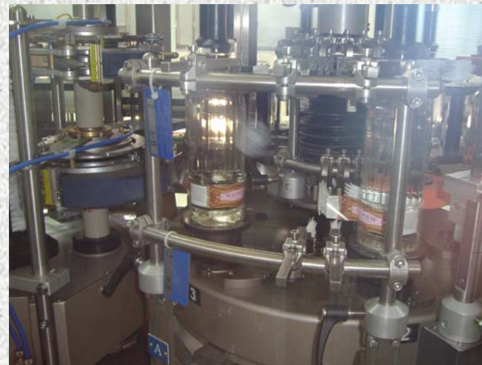
Planta Embotelladora de Agua Mineral Natural