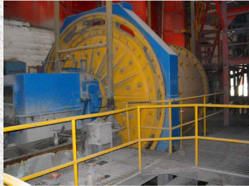
Planta de Concentración y Beneficio de Mineral