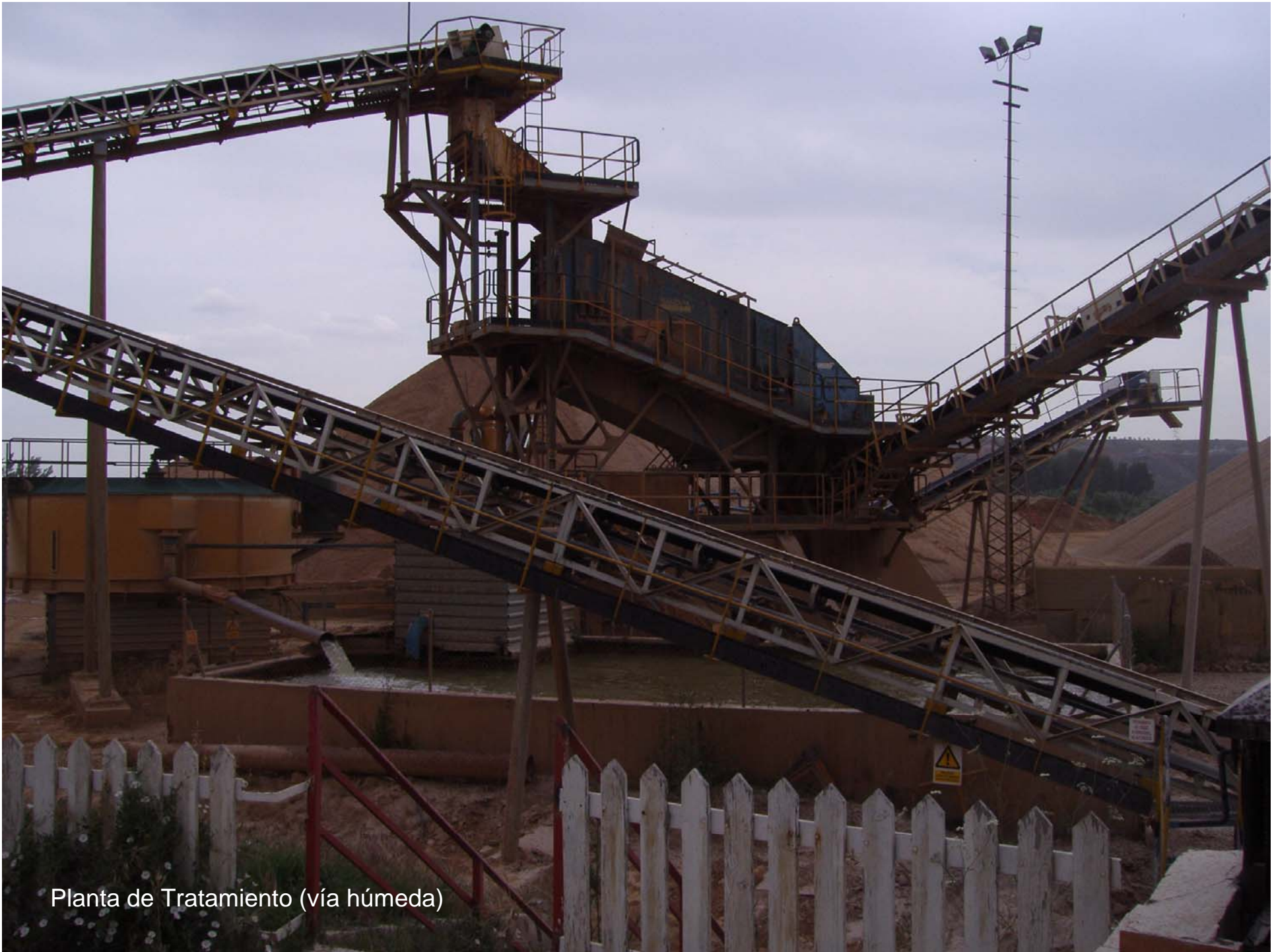
Planta de Tratamiento (vía húmeda)